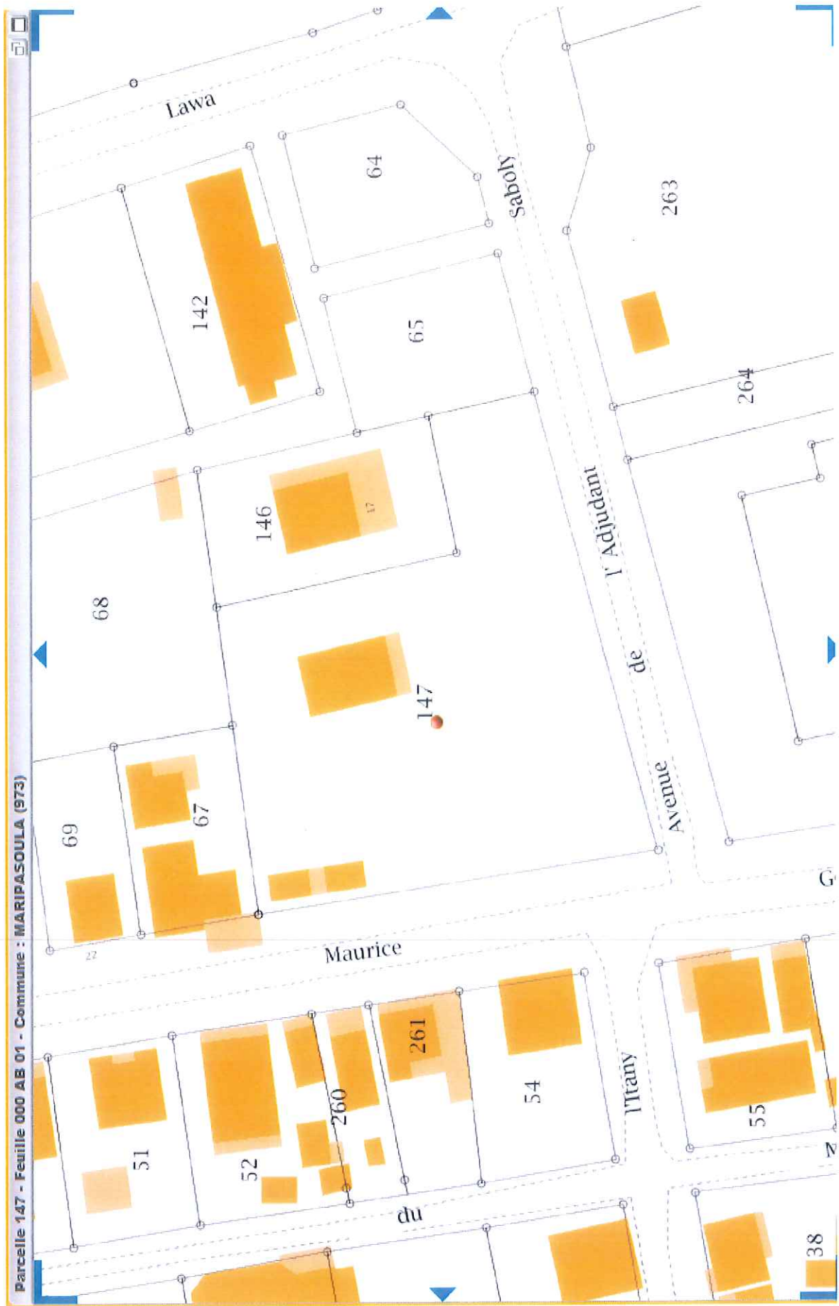
Plan cadastral, parcelle section AB numéro 147, commune de Maripasoula