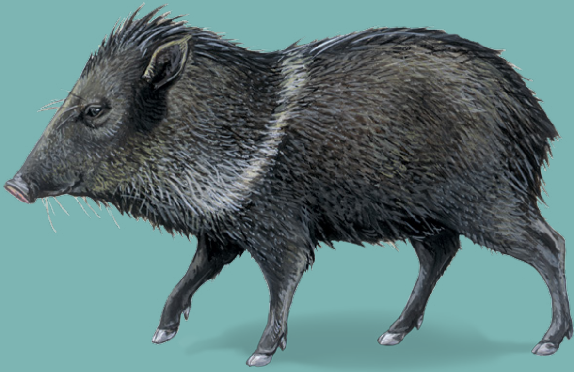
Pakira PÉCARI À COLLIER Tayassu tajacu