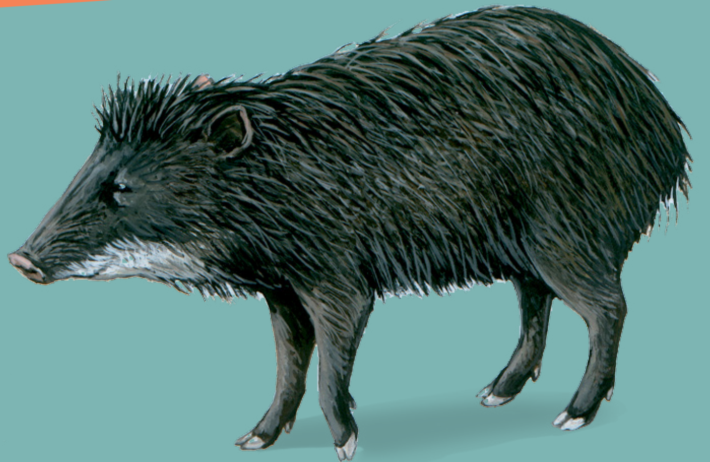
Kochon bwa PÉCARI À LÈVRE BLANCHE Tayassu pecari