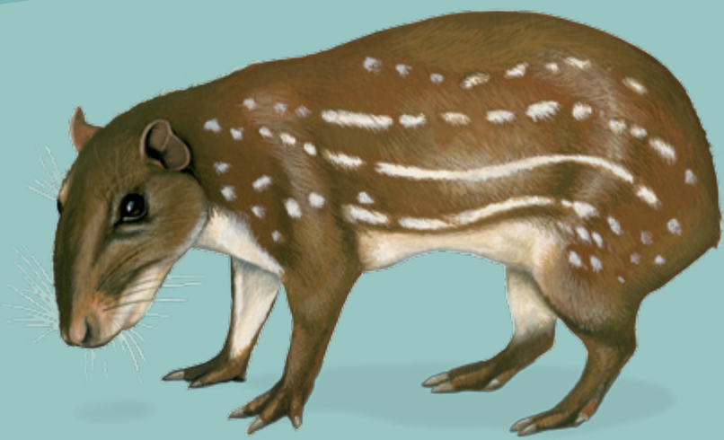
Pak PACA Agouti paca