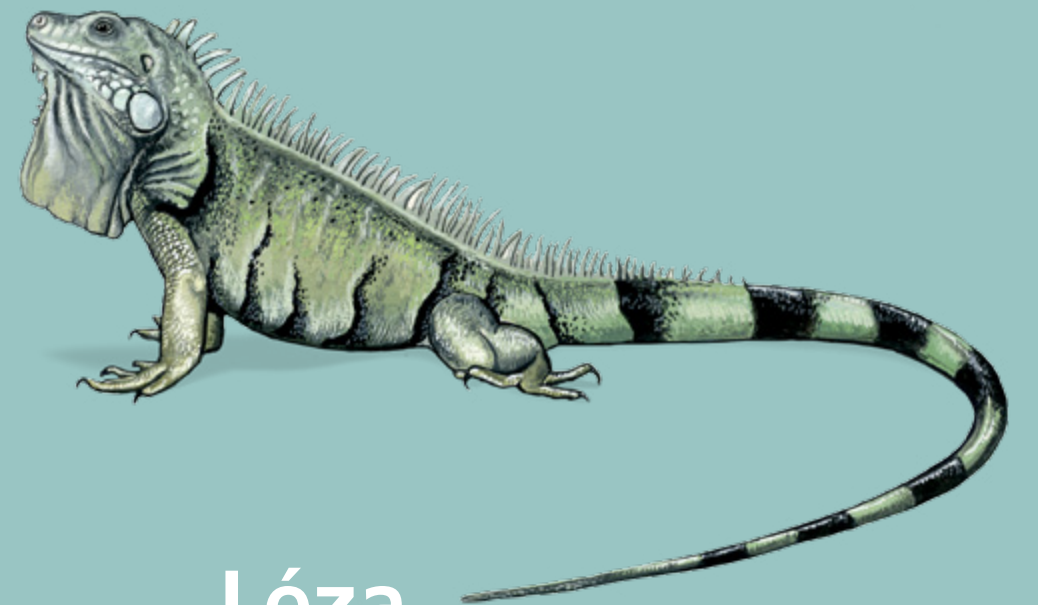
Léza IGUANE VERT Iguana iguana