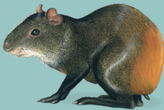
Agouti AGOUTI Dasyprocta agouti