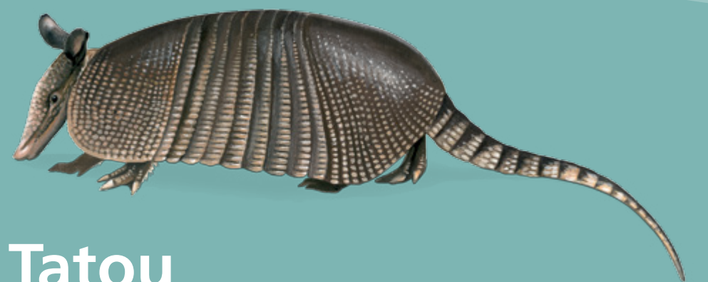
Tatou TATOU A NEUF BANDES Dasyus novemcinctus