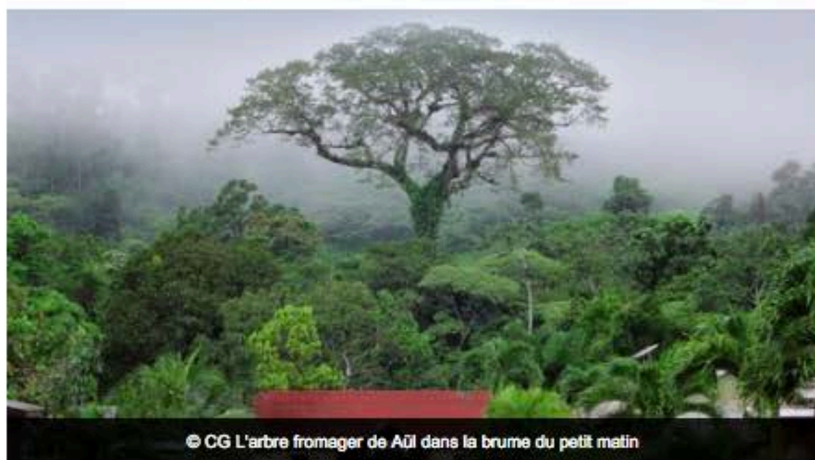
L'arbre fromager de Aül dans la brume du petit matin

Pour cette édition 2015 la Guyane a été retenue parmi 180 candidatures au concours national de « l'arbre de l'année ». Le Parc amazonien de Guyane a présenté la photo d'un fromager situé au cœur du village de Saül. A ce stade du vote il est très bien placé.