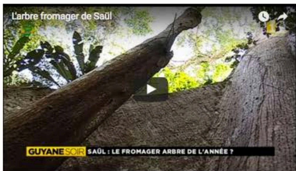
L'arbre fromager de Saül

Le reportage de Claire Giroud et Laurence Tian Sio Po