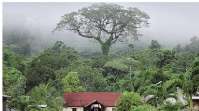
Le Fromager de Guyane a remporté le prix du public de l'arbre de l'année 2015.

Le Fromager de Saül en Guyane a devancé le Banian de La Réunion en remportant le prix du public du concours de l'arbre de l'année 2015. Le titre a été décerné par l'ONF et le magazine "Terre Sauvage" et annoncé ce mardi 29 septembre.