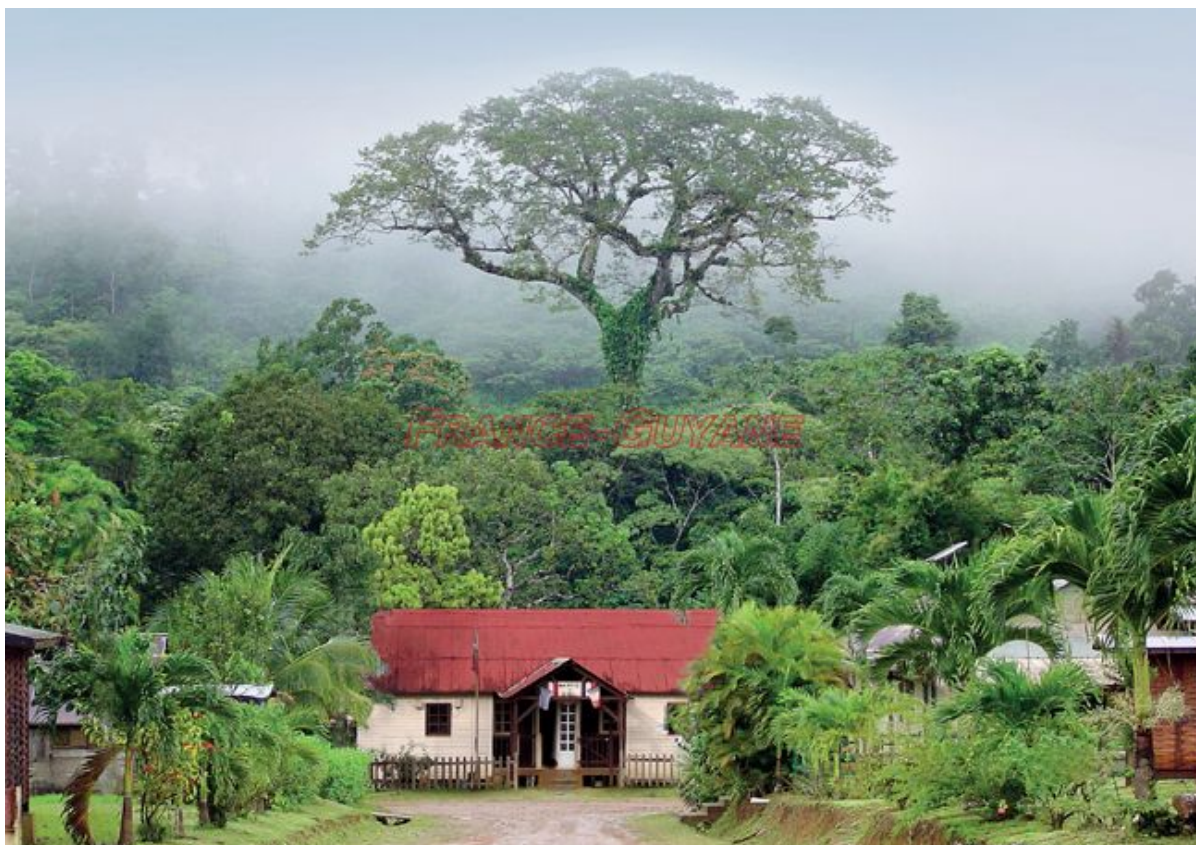
Cette photo a fait le tour du monde et du web en 2015