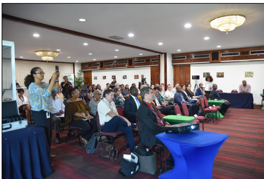
Foto 3: Deelnemers van de 3 landen wonen de lancering bij bijcipants of the 3 countries attending the launch