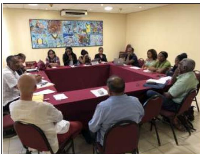
Foto 5: Werkgroep over een van de thematische gebieden

Het Environment Protection Agency (EPA) verschaft een normaal aanvraagformulier/protocol dat naar de wetenschappelijke commissie gaat (als er sprake is van traditionele kennis, moet informatie worden verstrekt aan de gemeenschappen en de schriftelijke toestemming gaat naar het ministerie). EPA werkt momenteel aan regelgeving voor ABS.