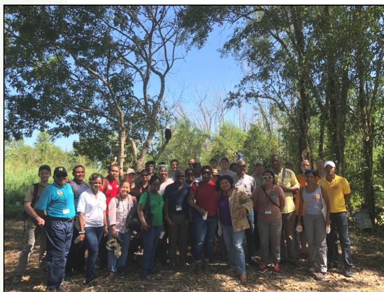
Foto 7: Deelnemers aan de excursie naar de lokatie van de rehabilitatie van mangroven te Weg naar Zee