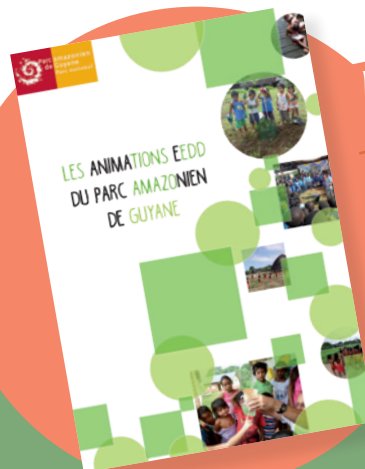
Répertoire d'animations et fiches pédagogiques